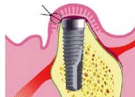
Immagine n. 3

L'osso sostiene il pezzo impiantato. In circa 3-6 mesi l'impianto si integra saldamente all'osso.