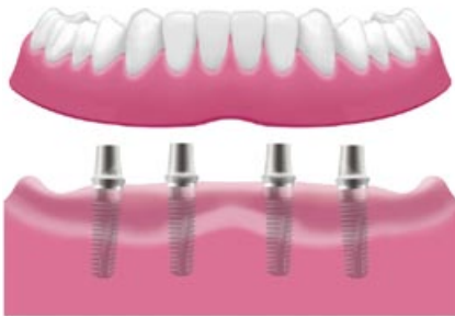
Fissaggio della protesi su impianto mediante capsule telescopiche (protesi visibile nella pagina precedente)