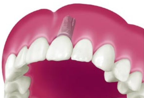
Capsula fissata all'impianto