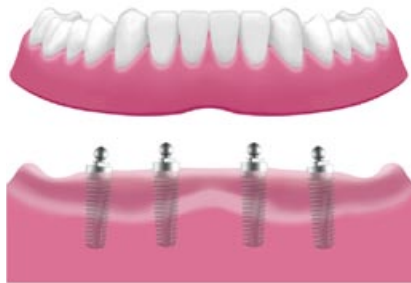
Fissaggio della protesi su perno sferico