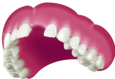
Stato di monoedentulia