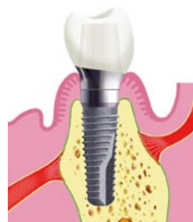
Immagine n. 4

Al termine della fase di guarigione il dentista adatta il perno all'impianto e vi posiziona quindi la capsula avvitandola bene alla struttura impiantata (immagine 4).