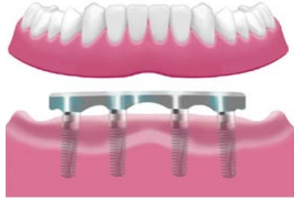
Fissaggio della protesi su impianto tipo Toronto