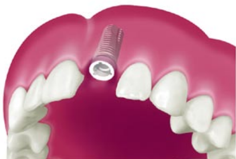
Impianto incassato nell'osso