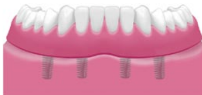
Ecco una protesi rimovibile fissata su impianti.